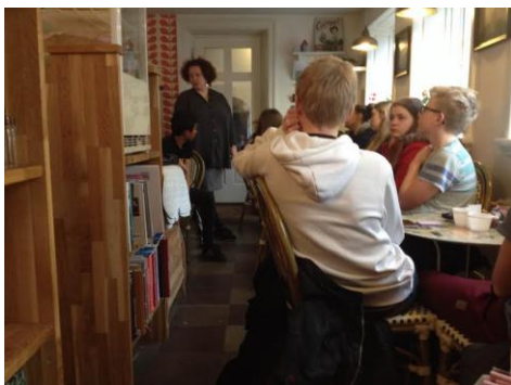
Besøg i Kaffekælderen i Køge.